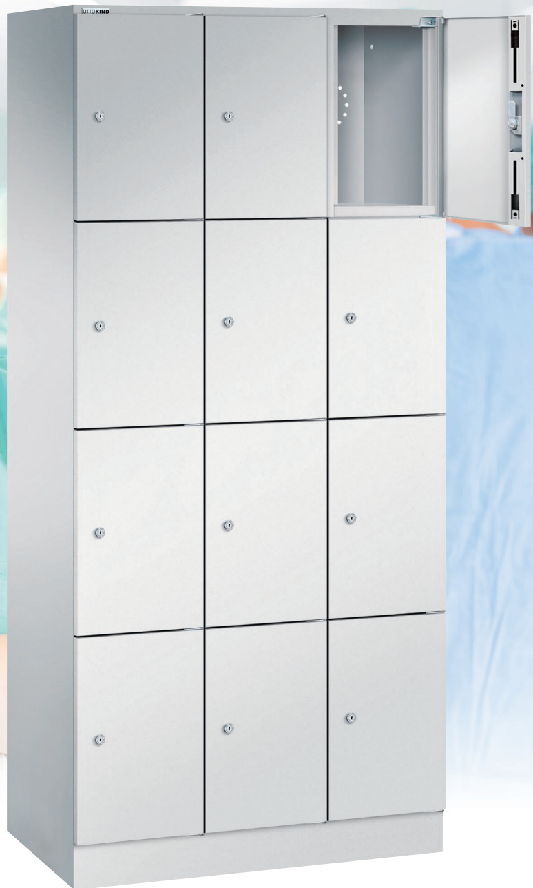
Schließfachschrank (Seite 5)